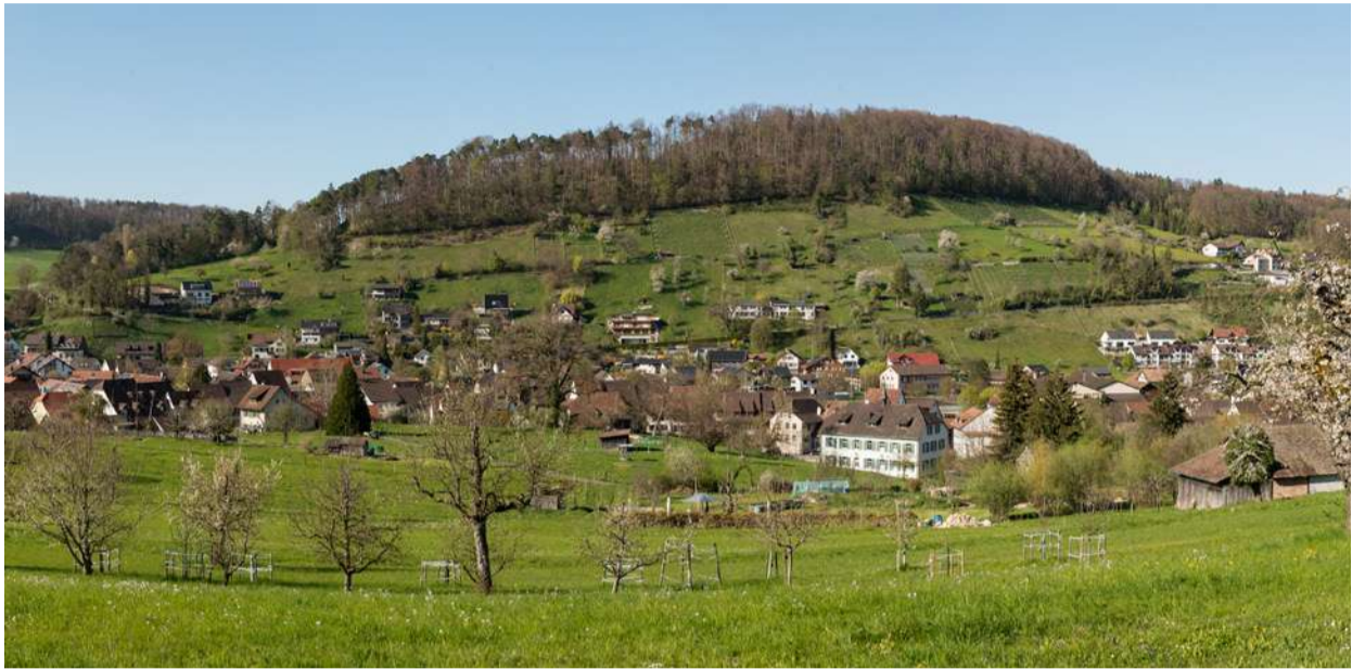
Die Rebhalde: Hier betreiben wieder einige Hobbywinzer Rebbau. Auch die Spazierwege sind beliebt.

Ziefen | Buch zum 800-jährigen Bestehen der Gemeinde