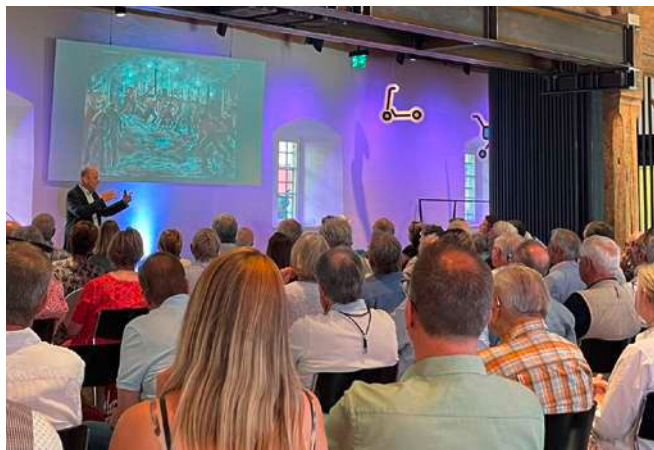
Jeder einzelne Stuhl im Alten Zeughaus in Liestal war besetzt.

kenntnisse zur Verteidigungsstrategie in der Nordwestschweiz zutage.